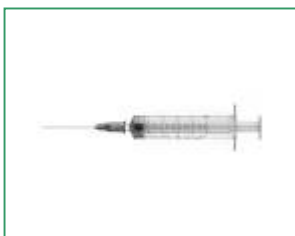
Siringhe monouso con ago