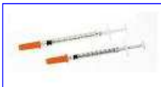
Siringhe da insulina