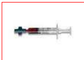
Siringhe da emogas analisi